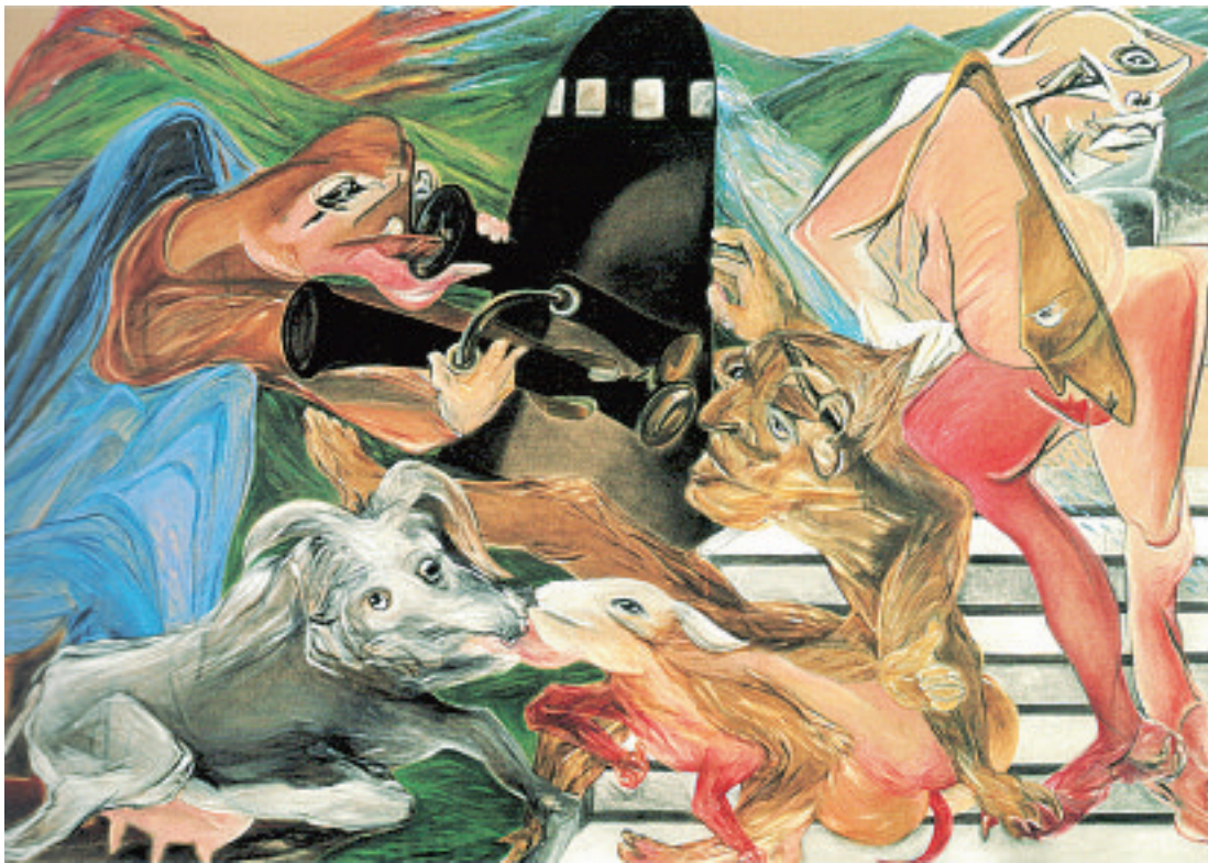
Lotti van der Gaag maakte veel fantasiefiguren en oerwezens, zoals 'Bosgod', uit 1966.